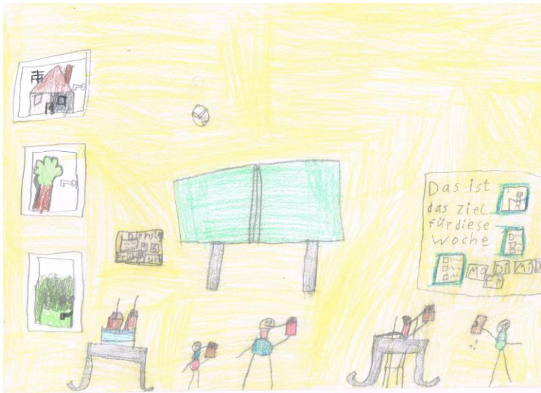
Schülerzeichnung (Klasse 3): Klassenraum