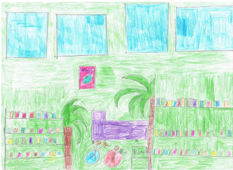
Schülerzeichnung (Klasse 4): Unsere „Leseinsel“